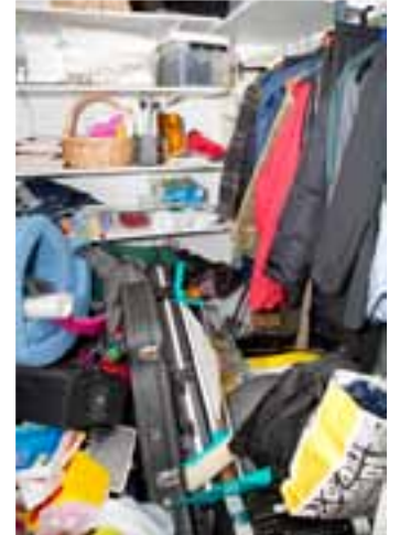
Tästä aloitetaan. Vaatehuoneen hyllyt ovat tyhjiä, koska lattialla olevat tavarat estävät sisäänpääsyn.

Ammattijärjestelijä ei tuomitse. Jokaisella on syynsä, miksi koti on sekaisin.