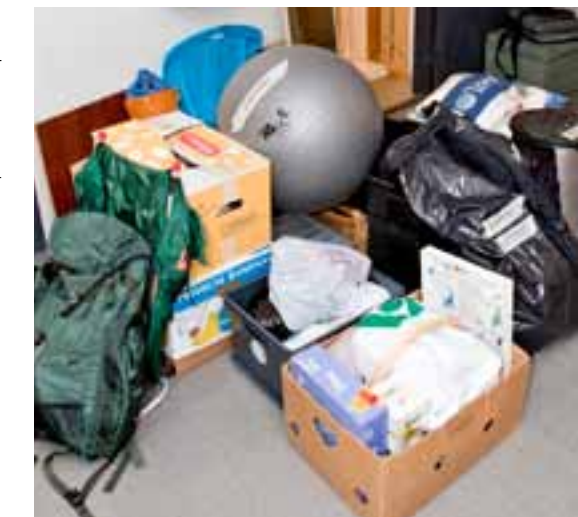
Vauvanvaatteita, urheiluvälineitä ja tyhjiä laatikoita. Kun urakka on ohi, käytävään on kertynyt pakettiautollinen turhaa tavaraa.

Tekemistä riittää. Aion tilata järjestäjän vielä yhdeksi päiväksi syksyllä. Haluan käydä läpi ainakin keittiönkaapit ja katos, tarvitsenko jokaisen isoäidin vanhan punssilasini."