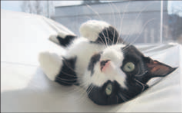
Tättä näyttää miellestelevä tunkeilija nimeltä Nala.