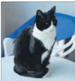
Olli suostui tahmeasti muutamaan uuteen kotiin.